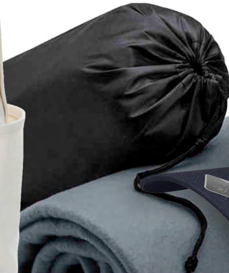
ПЛЕД КАУЧА H-346748/28