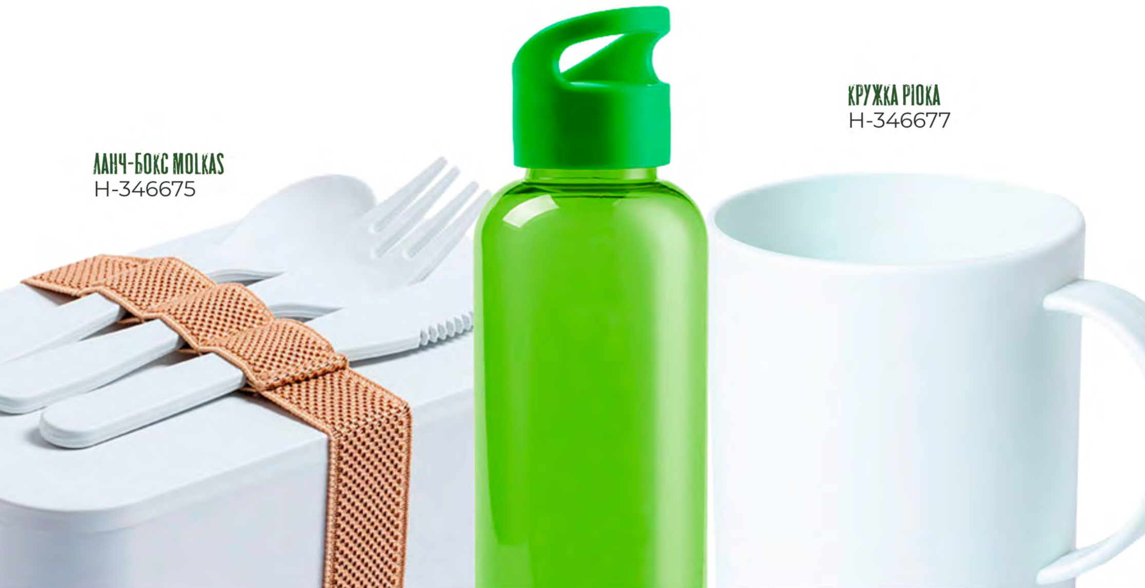
ЛАНЧ-БОКС MOLKAS H-346675