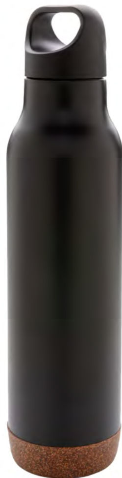
ГЕРМЕТИЧНАЯ ВАКУУМНАЯ БУТЫЛКА СОРК, 600 МЛ P433.281