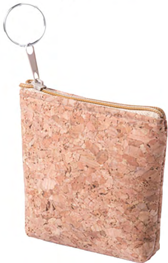
ФУТЛЯР ДЛЯ МЕЛОЧИ DABEU 345881