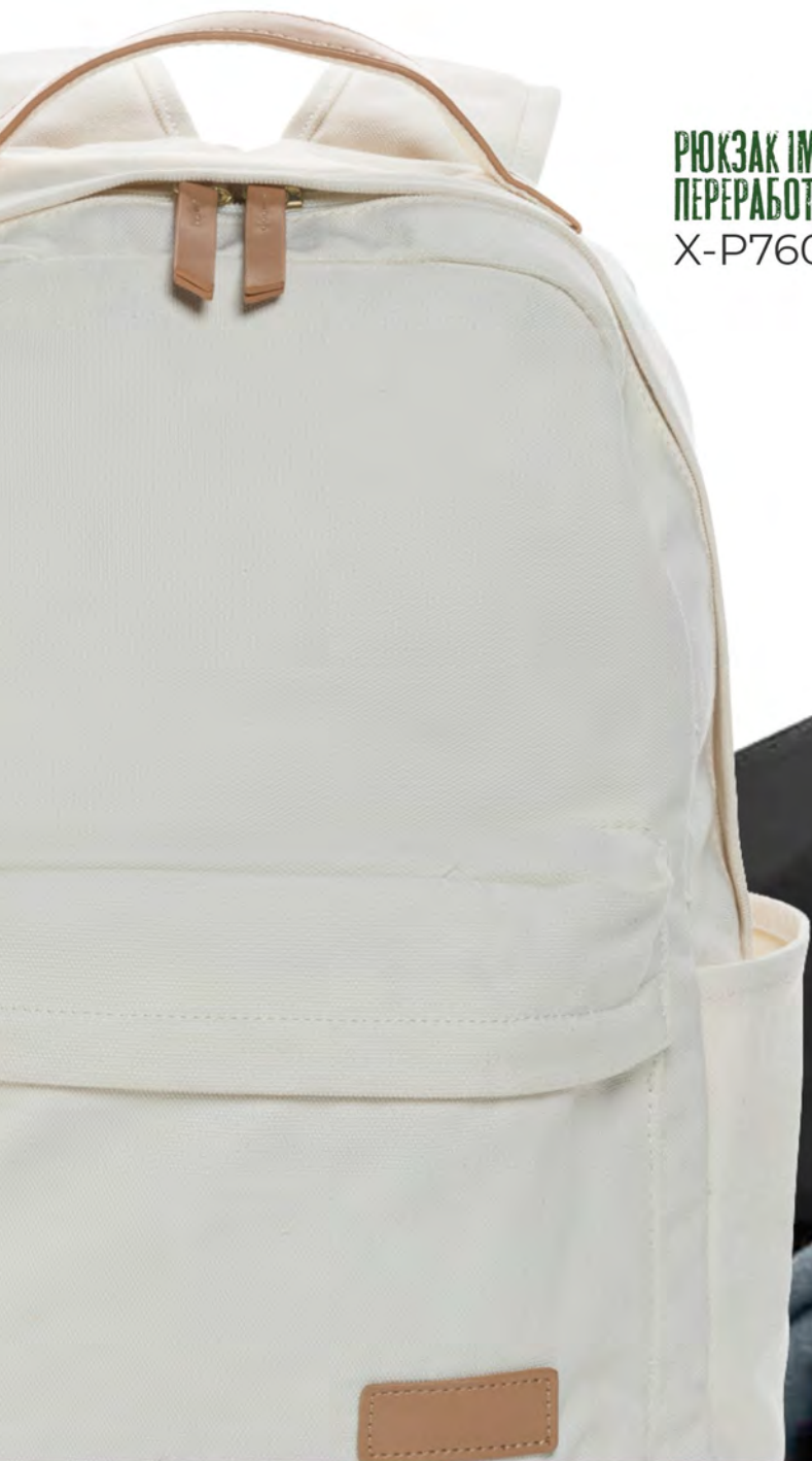
РЮКЗАК IMPACT ИЗ ПЕРЕРАБОТАННОГО КАНВАСА X-P760.220