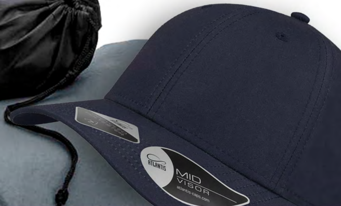
БЕЙСБОЛКА RESU FEEL H-254220.01